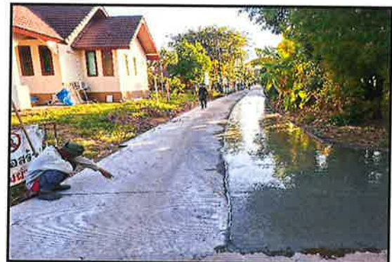
ภาพกำลังดำเนินการ