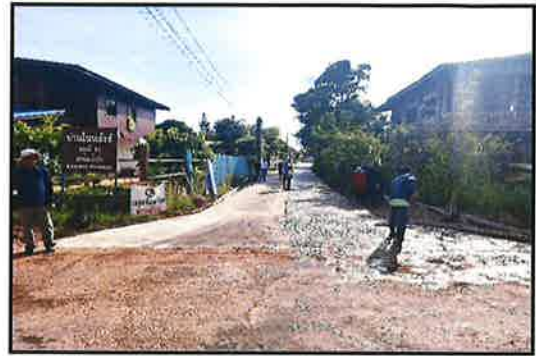
ภาพกำลังดำเนินการ