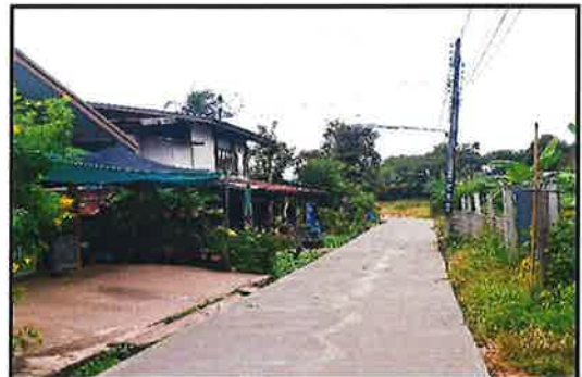
ภาพดำเนินการแล้วเสร็จ

โครงการปรับปรุงถนน ค.ส.ล. จุดที่ ๓ (สายบ้านน้ำก่ำใต้) หมู่ที่ ๓ บ้านน้ำก่ำใต้ อ.ธาตุพนม จ.นครพนม