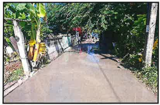
ภาพกำลังดำเนินการ