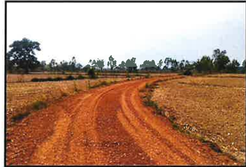
ภาพดำเนินการแล้วเสร็จ