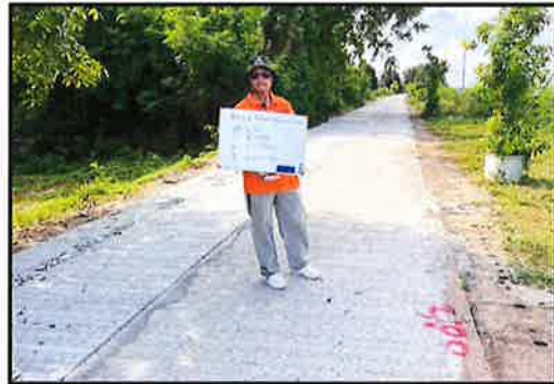
ภาพดำเนินการแล้วเสร็จ

โครงการก่อสร้างถนนคอนกรีตเสริมเหล็ก สายอ่างเก็บน้ำ บ้านดอนข้าวหลาม หมู่ที่ ๙