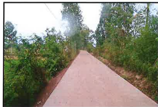
ภาพดำเนินการแล้วเสร็จ