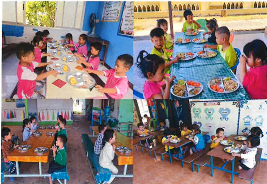
วัสดุงานบ้านงานครัวอาหารเสริม (นม)