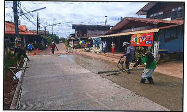
ภาพกำลังดำเนินการ