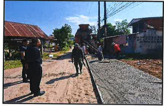
ภาพกำลังดำเนินการ