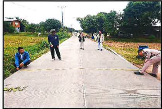
ภาพดำเนินการแล้วเสร็จ

โครงการปรับปรุงถนน ค.ส.ล. จุดที่ ๒ (สาย รพ.สต.น้ำก่ำ) หมู่ที่ ๓ บ้านน้ำก่ำใต้ ต.น้ำก่ำ อ.ธาตุพนม จ.นครพนม