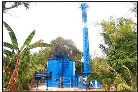
ภาพดำเนินการแล้วเสร็จ